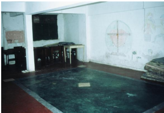
Die alte Bussgarage