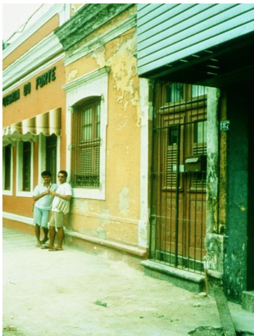
1988 das erste Haus