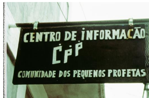
1988 Gründung der CPP